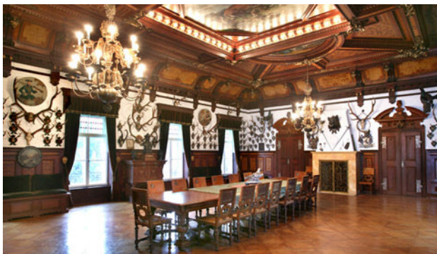
Der prachtvolle Jagdsaal

Ob Traumhochzeit, Taufe oder diverse Gala-Veranstaltungen von bis zu 30 Personen.